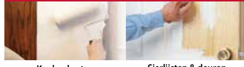
Keukenkasten Sierlijsten & deuren