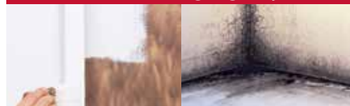
Brandschade Duffe schimmel en meeldauw