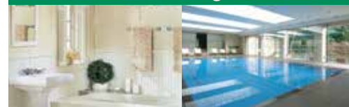
Badkamers Muren van poolhuizen