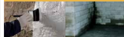
Droge ondergrond Vochtige ondergrond