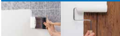
Keramische tegels Lambriseringen